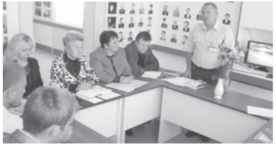
Участники мероприятия обмениваются мнениями по актуальным вопросам